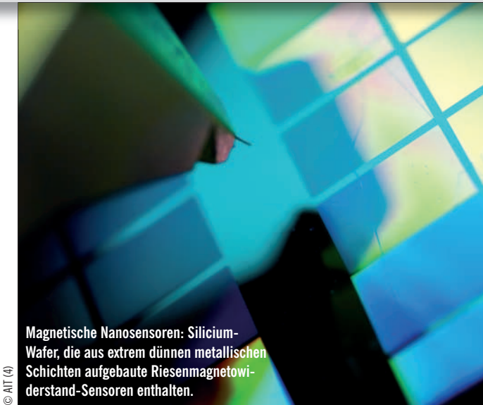
Magnetische Nanosensoren: Silicium-Wafer, die aus extrem dünnen metallischen Schichten aufgebaute Riesenmagnetowiderstand-Sensoren enthalten.